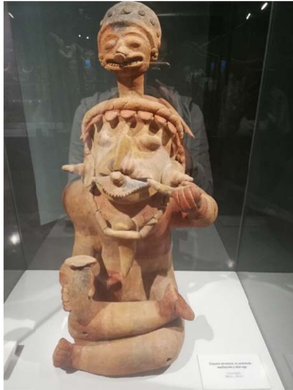
Obr. 2. Národní muzeum v Quito - sekce předkolumbovského umění, Název: Kokéro (šaman užívající koku k dosažení transu. pozn. autorky) a alterego.

Gualaquiza je městem nacházejícím se v regionu Morena-Santiago v jihovýchodní části Ekvádoru (viz. přiložená mapa s mou přesnou lokací níže) a leží na území tradičně obývaném Šuary. Ve městě je možné navštívit skromné informační centrum s informacemi o kulturách relevantních k této oblasti (Šuarové a Kaňari) a archeologickými nálezy a artefakty. V oblasti je možné navštívit řadu vodopádů, a také několik šuarských komunit a ve městě je pak každý den trh s tradičními výrobky domorodců a s komunitami vypěstovanými ovocem a zeleninou. Nedaleko města sídlí také šuarská komunita ve vesnici u řeky Kupiamais vedená Uwishinem (šuarsky „vědoucí“, což je označení pro osobu na kterou většinou v západním světě referujeme jako na šamana), kam jsem měla namířeno.