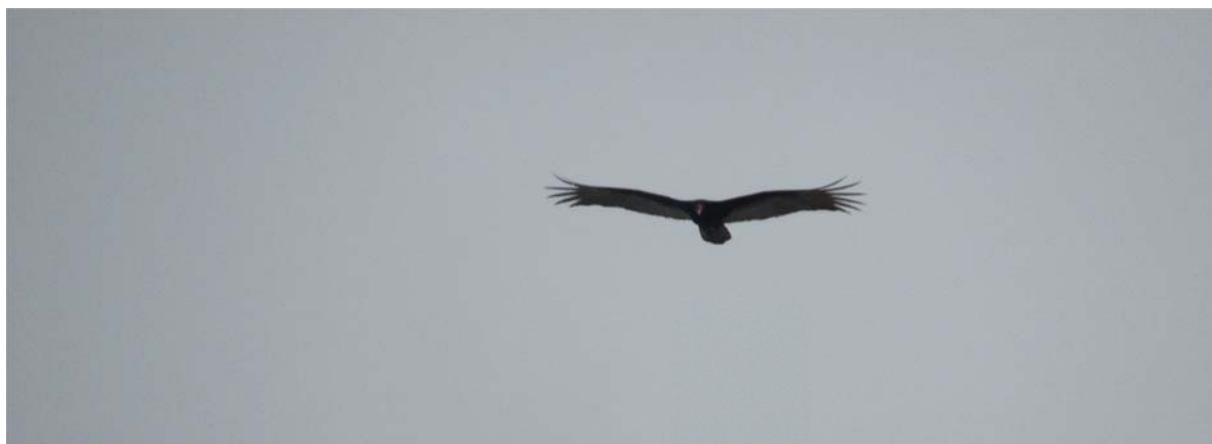
Obr. 1. Kondor.

Díky finanční podpoře z programu Freemover jsem mohla uskutečnit svůj výzkumný pobyt v Ekvádoru. Ten proběhl od 11.7 do 9.9. 2019 a jeho cílem bylo získat data pro mou dizertační práci u domorodých Šuarů. Šuarská kultura je ve světě známá zejména svým bojovným duchem a nepoddajností (vždyť oni byli posledními neporobenými španělskými kolonizátory) a také výrobou tzv. tsants – produkt preparování lebek a zmenšování hlav svých nepřátel vařením. Šuarská kultura však dalece přesahuje výše zmíněné, a nejen v komunitě, kam jsem měla namířeno, dávno vstoupili na globální trh s nabídkou léčebných kúr za užití rostlin jako jsou ayahuasca, durman, tabák a také produkcí komplexnějších vícedenních rituálů. Mým záměrem bylo zmapovat v kontextu globalizace ayahuascy reprodukci jednoho z těchto komplexních rituálů pro zahraniční návštěvníky – Natemamu.