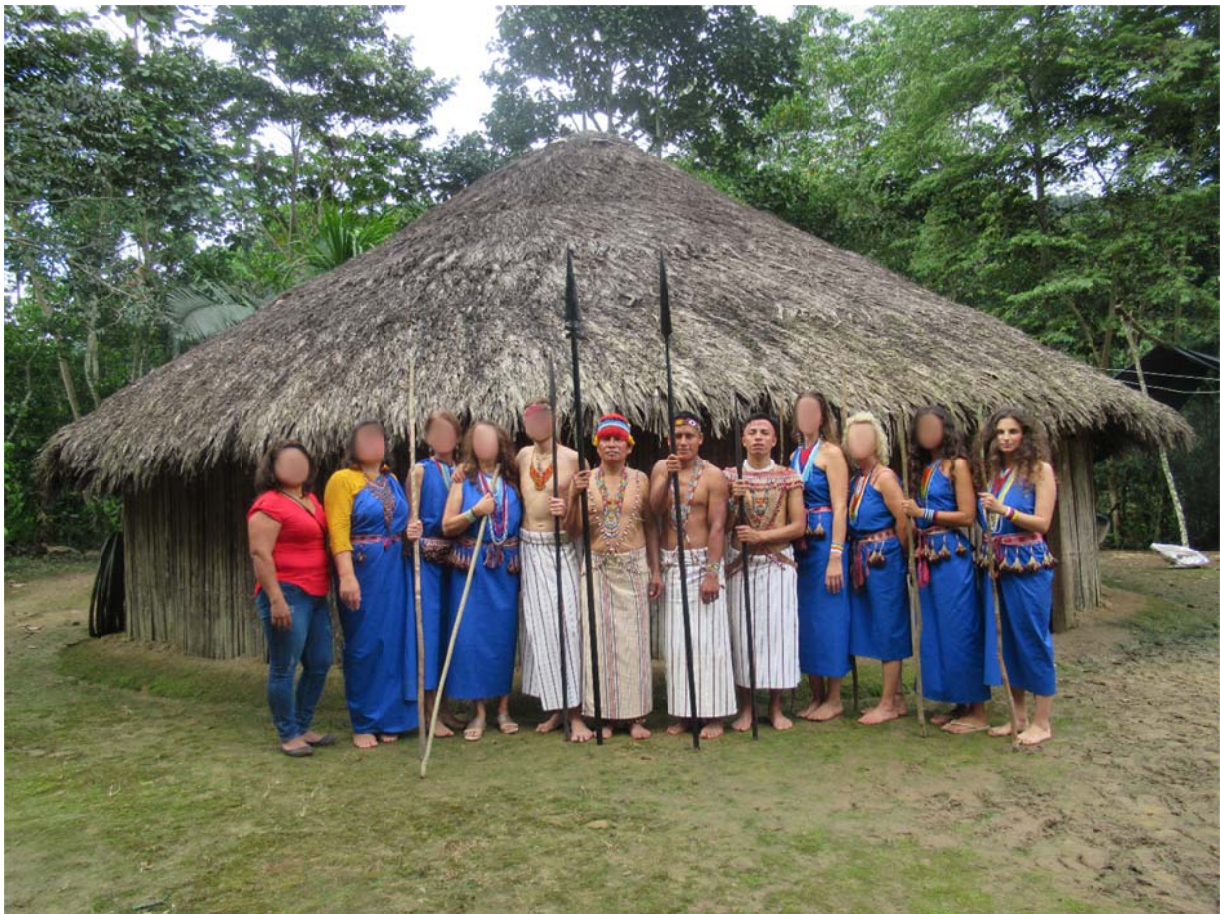
Obr. 6. Účastníci Natemamu po závěrečné ceremonii a za nimi tradiční ceremoniální místnost.

K závěru bych chtěla vyjádřit, jak moc si vážím možností, které díky podpoře univerzity máme jako studenti k tomu, abychom mohli cestovat, poznávat způsob života v jiných kulturách a realizovat vlastní práci, vize, projekty. Díky tomu můžeme obohacovat vlastní život o nové poznání a prožitky. Ačkoliv cestování někdy i u mě vyvolává strach, nervozitu a úzkost z nového a nejistého, každá taková cesta mě osobně posouvá mílovými kroky vpřed. Cesta do Ekvádoru a celý rituál, který jsem podstoupila byly náročné, ale měly nesmírně pozitivní dopad na můj život, způsob prožívání a pohled na svět.