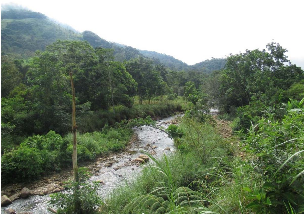
Obr. 4. Řeka Kupiamais a její okolí.

Ubytování u šuarů bylo nad očekávání dobré, neboť bylo přizpůsobeno zahraničním návštěvníkům. Splňovalo tak určitý standard, na který jsme v západním světě zvyklí, jako jsou například splachovací záchody, základní dřevěné postele, uzamykatelné pokoje a dokonce wifi (!!). Bylo zřejmé, že se jednalo o reakci na zahraniční návštěvy, jelikož jsem od dlouholetých účastníků zjistila, že ještě před pár lety se spalo na zemi v tradiční kruhové stavbě z palmového dřeva a jiný záchod, než suchý k dispozici nebyl. Evidentně po stížnostech ze strany západních příchozích došlo u šuarů k určitému přizpůsobení klientele a k reakci na poptávku.