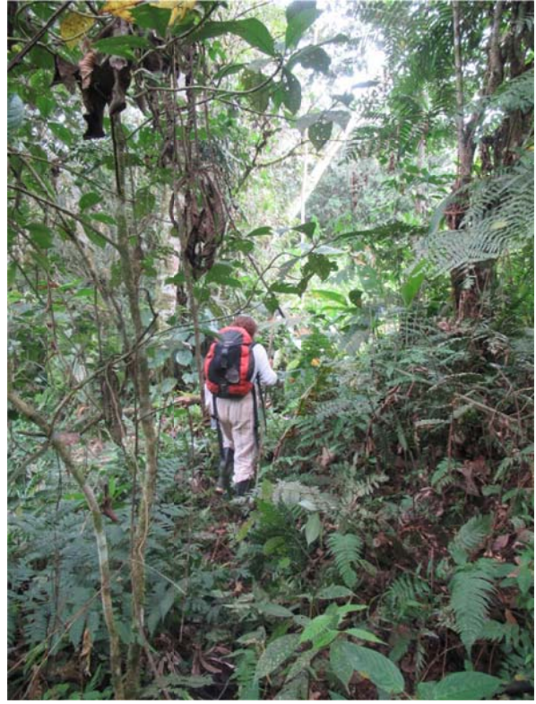
Obr. 5. Pochod džunglí k řece Bomboiza.